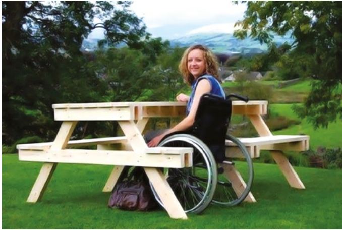
RYS. 3.3. Stół piknikowy z miejscem dla osoby na wózku inwalidzkim