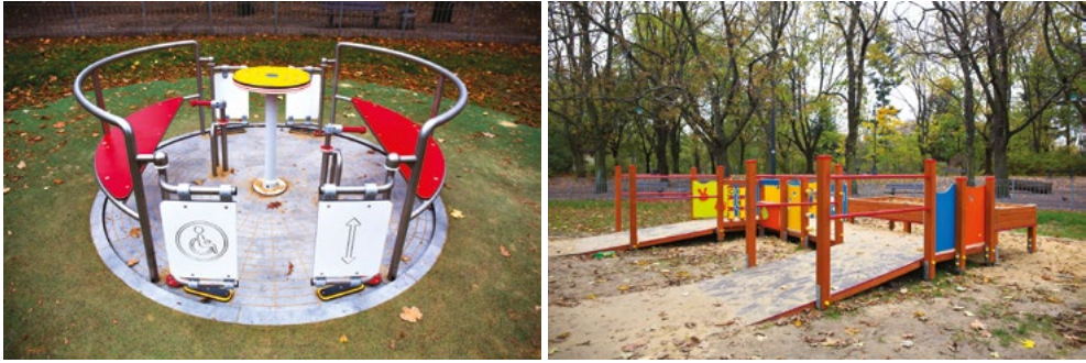
FIG. 3.2. Accessible platform and carousel on the playground

Another good practice related to the design of small architecture is a picnic table with a reserved space for a person in a wheelchair (Fig. 3.3). Thanks to this, such a person will not be excluded from joint participation in a meal or rest.