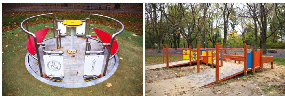
RYS. 3.2. Dostępne urządzenia na placu zabaw

Plaże jako tereny rekreacyjne to miejsca, które ze względu na swoją naturalną budowę są niedostępne dla wielu osób o specjalnych potrzebach, w szczególności dla osób poruszających się na wózkach inwalidzkich. Jak pokazuje przykład jednej z polskich plaż (Rys. 3.1), możliwe jest zagospodarowanie terenu tak, aby znalazły się na nim dodatkowe podesty oraz pochylnie umożliwiające swobodny dojazd do wody. Innym przykładem jest przedstawione poniżej (Rys. 3.2) urządzenie znajdujące się na jednym z warszawskich placów zabaw. Zostało ono skonstruowane tak, aby możliwe było jego użytkowanie dla osób poruszających się z wykorzystaniem różnych urządzeń pomocniczych (w tym wózków inwalidzkich). Kolejną dobrą praktyką związaną z projektowaniem małej architektury jest stół piknikowy z wyciętym miejscem dla osoby poruszającej się na wózku (Rys. 3.3). Dzięki temu taka osoba nie będzie wykluczona ze wspólnego posiłku lub odpoczynku.