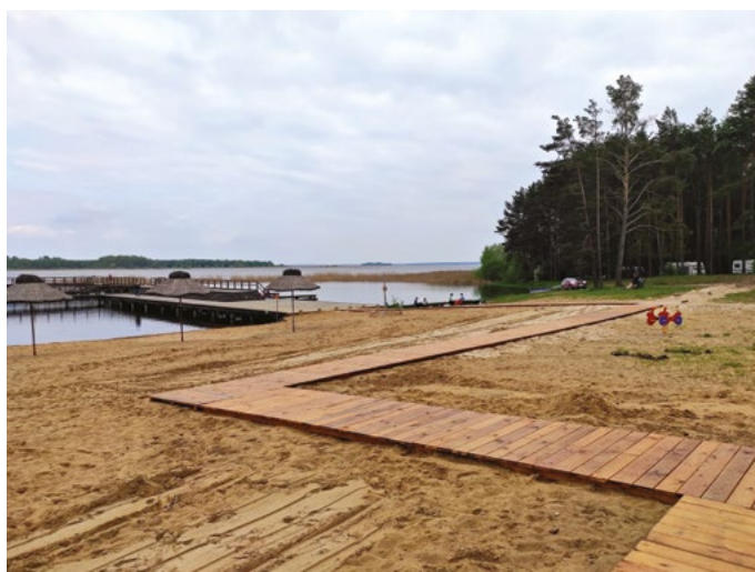
FIG. 3.1. Beach in Bondary near Siemianówka reservoir with accessible feature

Following design guidelines developed by ergonomics specialists is necessary for designing accessible spaces, but often such guidelines are intended to ensure only minimal functionality of individual places. Respecting legal requirements alone is currently not sufficient to design fully accessible spaces. Therefore, the important aspects of this process are the experience and knowledge of the designers themselves. The search and study of realizations that take into account the needs of people with different abilities expand the range of design solutions for every professional. As a result, designers can be able to provide higher-level accessibility – not only for security but also for the functionality of the places. Selected examples of good practices that show how to approach accessibility design in public spaces will be discussed below.