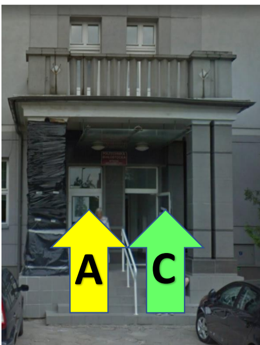
WEJŚCIE DO BUDYNKU GŁÓWNEGO