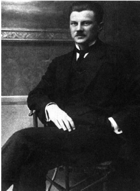
FOTOGRAFIA 19.3. Dr Władysław Szafer z czasów pracy w charakterze bakteriologa w 1916 roku w Lublinie

Po wybuchu I wojny światowej Szafer, zaciągnął się jako ochotnik do służby w Legionie Wschodnim pod dowództwem Józefa Hallera i służył tam jako podoficer. Po rozwiązaniu jednostki przez władze austriackie został skierowany na przeszkolenie w dziedzinie bakteriologii do Krakowa. W takim charakterze pracował w Łagiewnikach, Tarnowie, Kielcach i Lublinie (fot. 19.3).