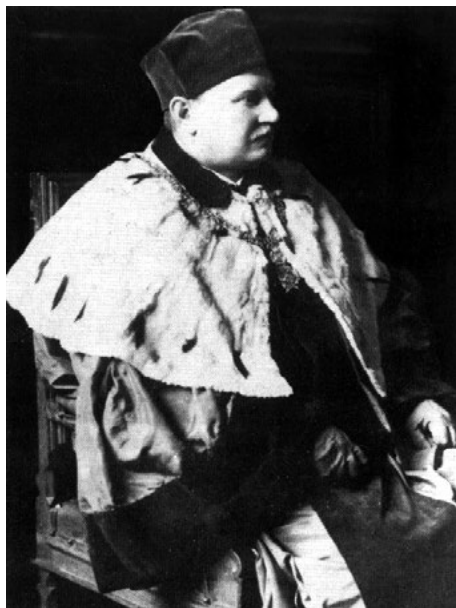
FOTOGRAFIA 19.6. Rektor Władysław Szafer w 1937 roku