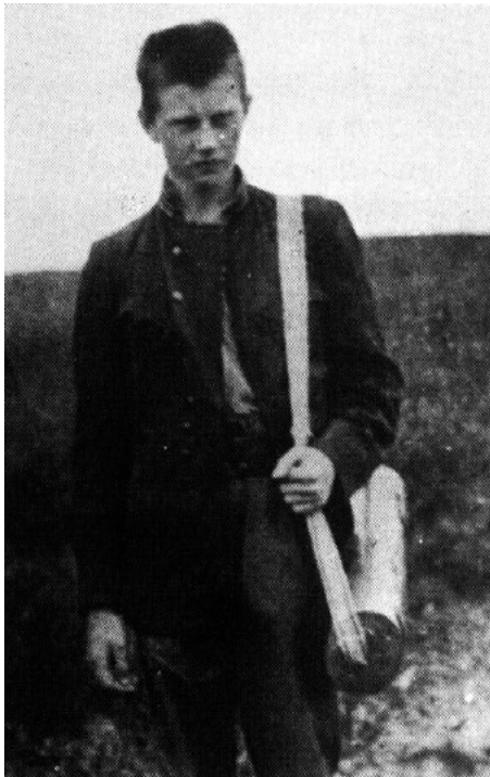
FOTOGRAFIA 19.2. Władysław Szafer w czasie studiów uniwersyteckich

Władysław Szafer urodził się 23 lipca 1886 roku w Sosnowcu. Szkołę powszechną ukończył w Mielcu i już wówczas interesował się przyrodą, bardzo chętnie uczestniczył w wycieczkach krajoznawczych i wiele godzin z upodobaniem spędzał w szkolnym gabinecie przyrodniczym. Kolejnym etapem jego nauki było Gimnazjum im. S. Konarskiego w Rzeszowie, które ukończył w 1905 roku, a na świadectwie maturalnym z przyrody otrzymał wyjątkowo rzadką ocenę – celujący ze szczególnym odznaczeniem.