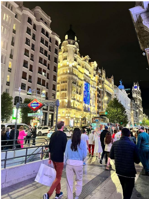
3. Gran Vía