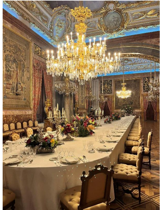
10. Pałac Królewski