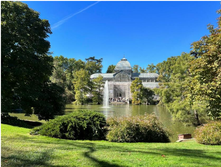
11. Park Retiro