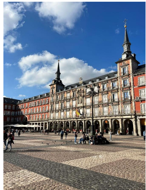
4. Plaza Mayor