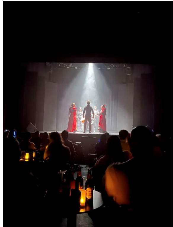
6. Pokaz Flamenco