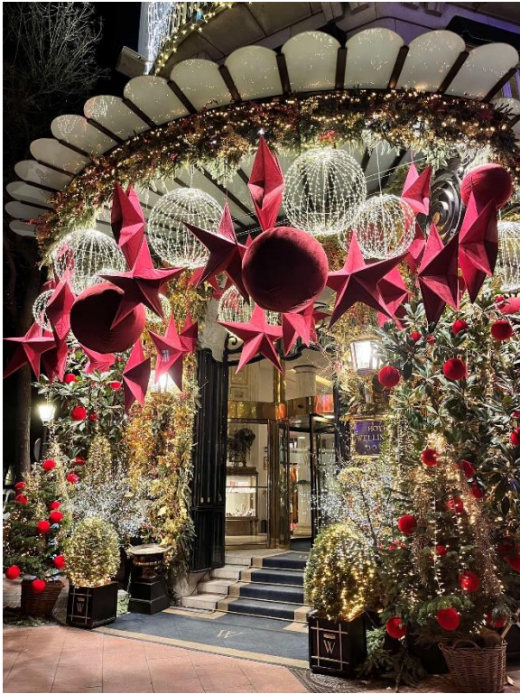
5. Świąteczne dekoracje w dzielnicy Salamanca