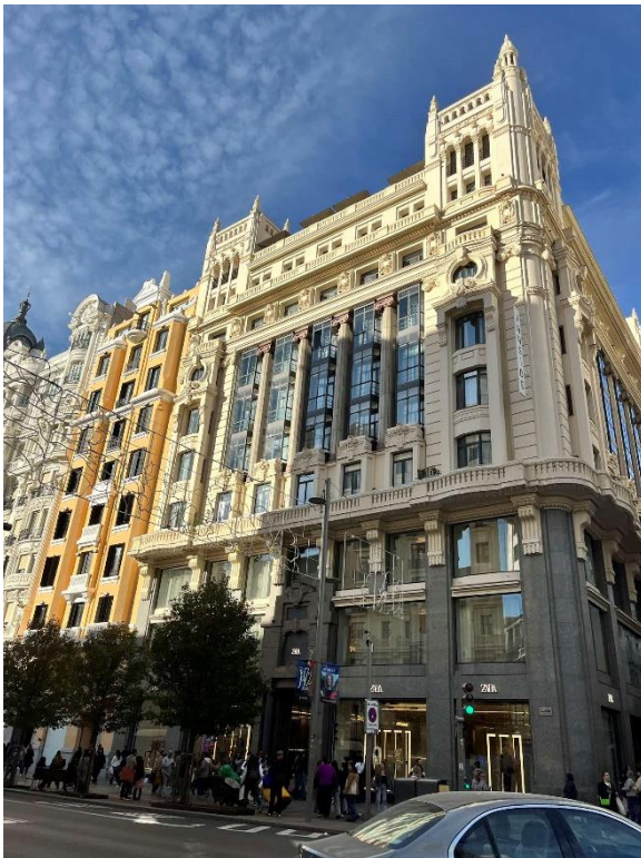
7. Gran Vía