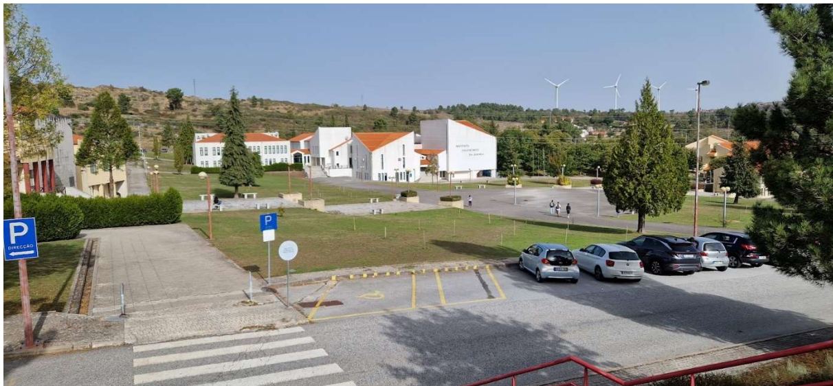
Na zdjęciu Campus uczelni, położony w górskim regionie Portugalii

Nazwa uczelni: Polytechnic Institute of Guarda